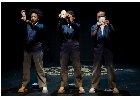
FIGURE IT OUT wandert jährlich zwischen Berlin, Leipzig und Stuttgart und zeigt die Vielfalt des zeitgenössischen Figuren- und Objekttheaters. Zum 30. Jubiläum 2023 in Berlin präsentierte das Festival Tage voller Experimente mit Puppen, Sound-Objekten, Materialien, Avataren und Masken, dazu viele Begegnungsmomente zwischen dem Publikum. Abgerundet wurde das Programm von einem dreitägigen Fachaustausch zu künstlerischer Forschung im Figuren- und Objekttheater und einer StageJam zur Erforschung des theatralen Potenzials von Online-Tools.

→ Zeitgenössisches Figuren- & Objekttheater Jährlich. Nächste Berlin-Ausgabe 2026. Die Berliner Ausgabe wird veranstaltet von Schaubude Berlin. ↗ schaubude.berlin